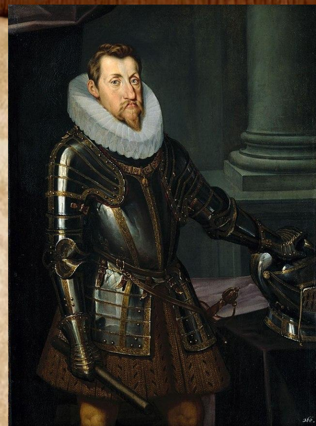
Фердинанд II Габсбург