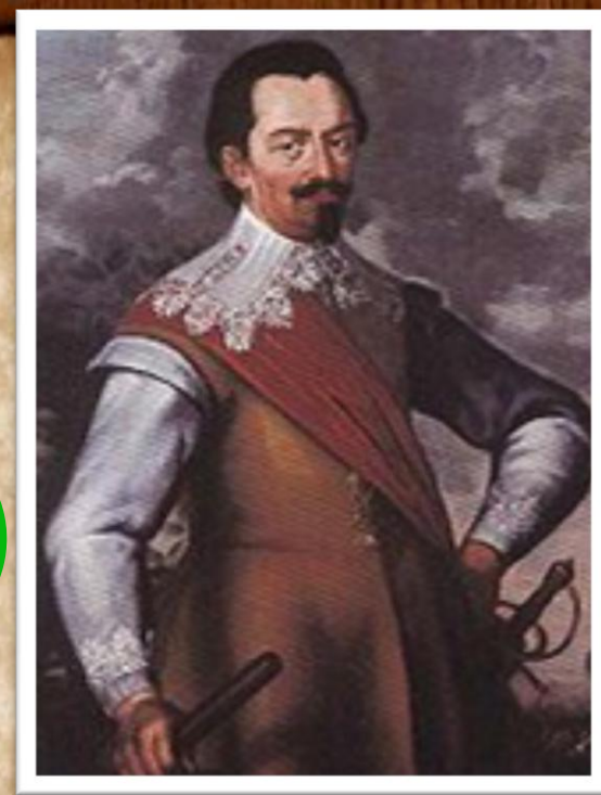
Альбрехт Валленштейн «Війна, годує війну»