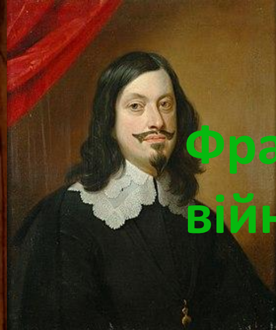
Фердинанд III Габсбург