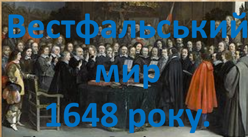
Підписання Вестфальського миру. 1648. Герард Терборх

Визнано незалежність Швейцарії та Нідерландів