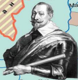
Густав II Адольф