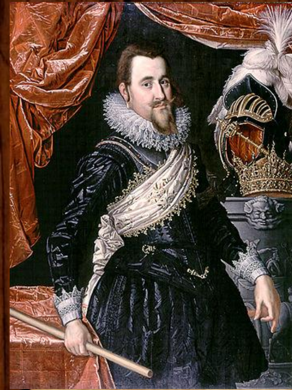
Крістіан IV Данський